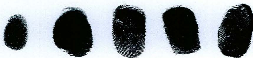
Figura No. 4.- Huella mal tomada (rodada dos veces)

Figura No. 3.- Huellas mal tomadas, ilegibles o difíciles de leer