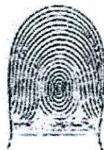
Figura No. 2.- Huellas tomadas correctamente:

Figura No. 1.- Área de la yema del dedo índice para la toma de huellas: