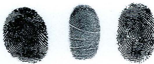
Figura No. 3.- Huellas mal tomadas, ilegibles o difíciles de leer

Figura No. 2.- Huellas tomadas correctamente: